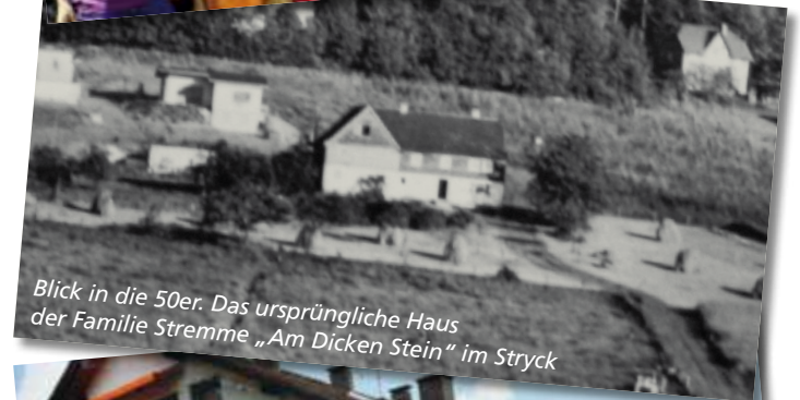
Blick in die 50er. Das ursprüngliche Haus der Familie Stremme „Am Dicken Stein“ im Stryck