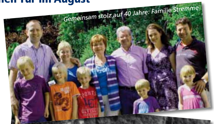
Gemeinsam stolz auf 40 Jahre: Familie Stremme

UPLAND-TIPS gratuliert zum Jubiläum und wünscht viele zufriedene Gäste und weitere erfolgreiche Jahrzehnte im „Edelweiss“.