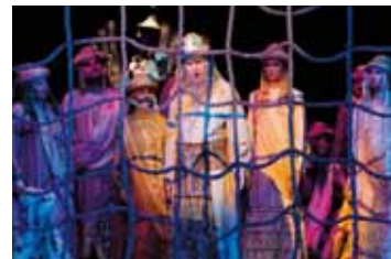
Seite 37: Nabucco Open Air an der Mühlenkopfschanze.

■ U-TIPS-Fotos: Bauschmann (HNA), Veranstalter