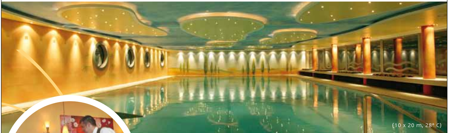
(10 x 20 m, 28° C)