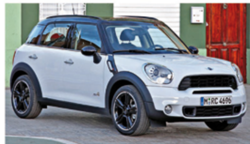
der neue MINI Countryman! - der erste MINI mit Allrad -