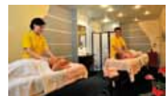
„Ganzkörpermassage“ mit kostbaren Ölen, Chocolat, Lulur, Tibet oder Hot Stone, 60 Min. 64,- Euro