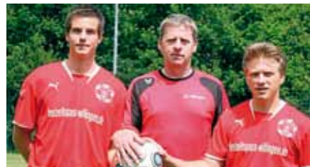
Seite 31: Die Neuzugänge des SCW freuen sich auf den Saisonstart.