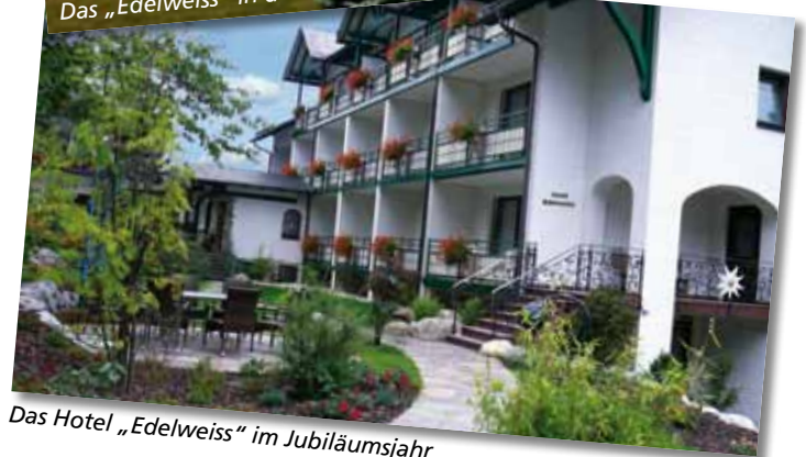
Das Hotel „Edelweiss“ im Jubiläumsjahr