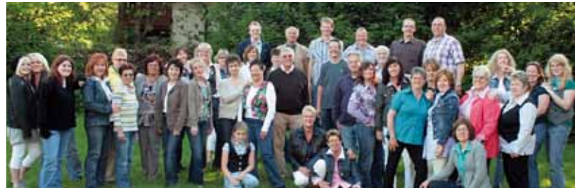
Seite 30: Der Gemischte Chor feiert sein Zehnjähriges.