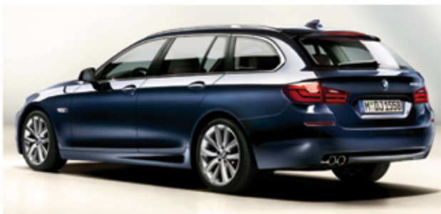
der neue BMW 5er Touring! - die schönste Form von Dynamik -