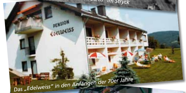
Das „Edelweiss“ in den Anfängen der 70er Jahre