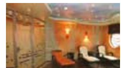
„Pediküre“ 45 Min. 31,- Euro