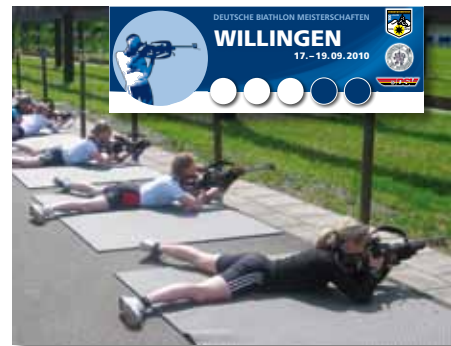
Schießtraining an der EWF-Biathlon Arena